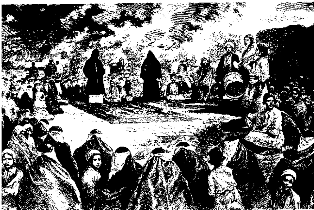
یکی از مراسم ترمزیه خوانی در زمان قاجار در شهر قزوین ظاهر این آئین عزاداری برای قتل یک نازی، ولی باطن آن سوگواری برای ترور هوش و خرد انسانها بوسیله واعظان و دکانداران مذهبی است.