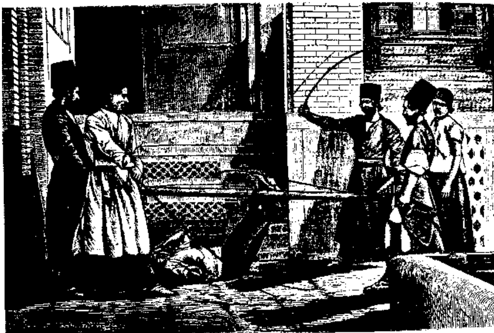
مراسم اجرای حکم دادگاه شرع نشانه‌ای از فساد اندیشه‌گری و ستمدینی در دورهٔ پادشاهان قاجار